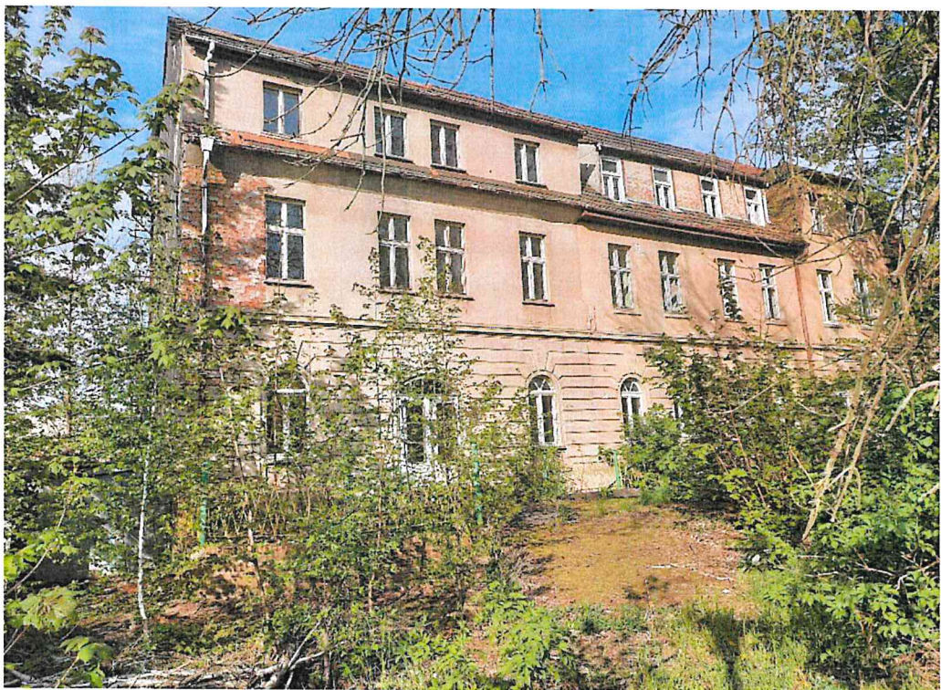
Außenbereich – Ansicht - Am Gaswerk