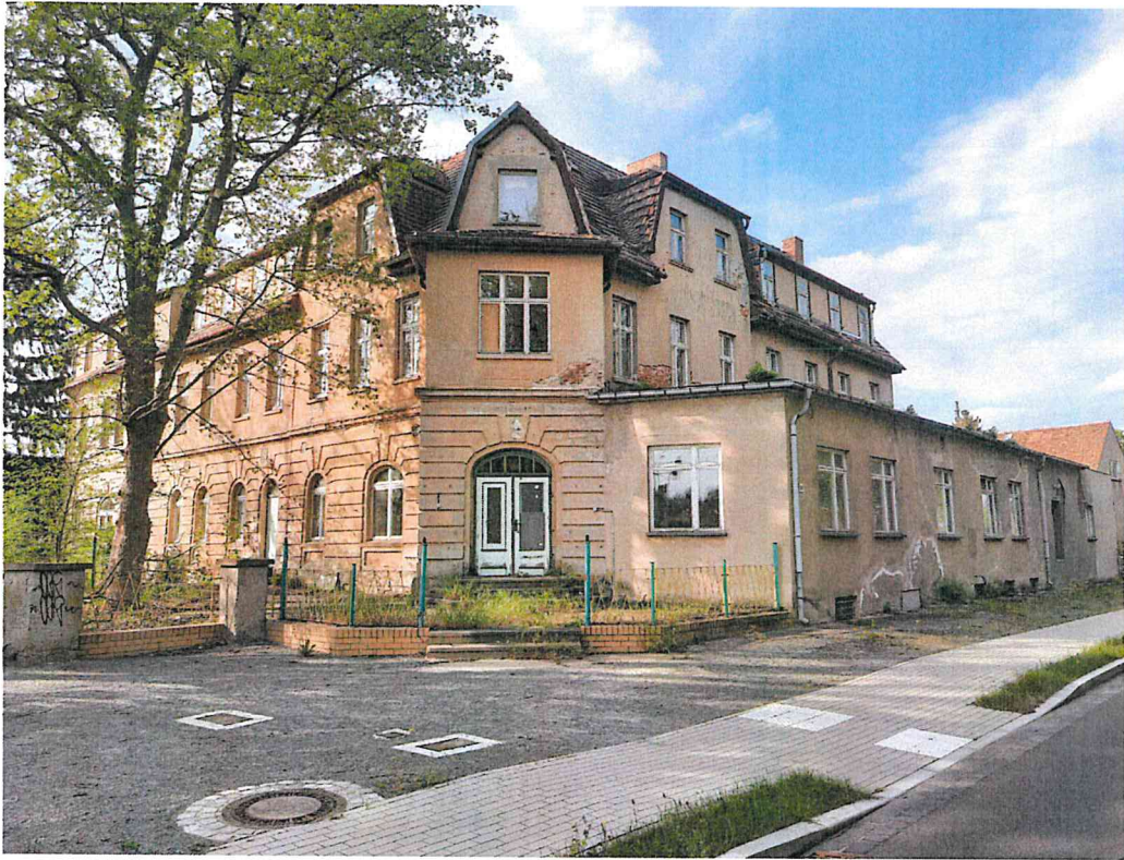
Straßenansicht Torgauer Straße